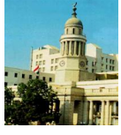
كلية طب _ قصر العيني