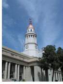
قطاع خدمة المجتمع و تنمية البيئة كلية طب _ قصر العينى