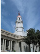
قطاع خدمة المجتمع و تنمية البيئة كلية طب _ قصر العينى